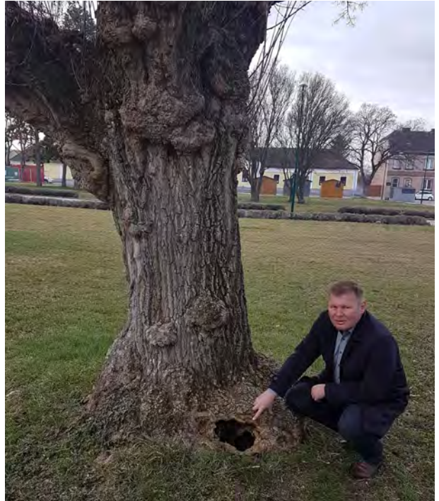
Bürgermeister Wolfgang Gaida deutet bei einem Parkbaum auf die Stelle, an der man erkennt, dass der Baum hohl und vom Pilz befallen ist.

Damit haben wir nach Fertigstellung des Baumkatasters absolute Gewissheit über den Zustand unserer Bäume. Die Verkehrssicherheit