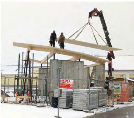
Im südwestlichen Eck des Parks wurde mit der Errichtung eines Pavillons für Veranstaltungen begonnen. Mit Ausrichtung zu einer Festwiese können dann im Park von Lesungen, über Verköstigungen, bis hin zu Konzerten vielerlei Veranstaltungen durchgeführt werden.