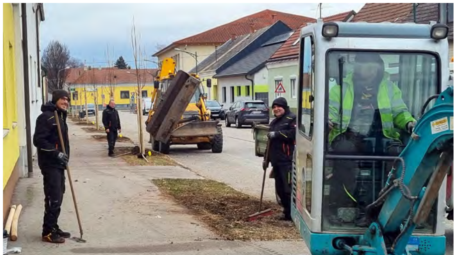
Im Ortsgebiet wurden rund 40 Bäume neu gesetzt, größtenteils als Ersatz für nicht standortgeeignete Pflanzen oder eingegangene Bäume.