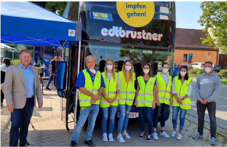
Ab September stand der NÖ Impfbus regelmäßig in unserer Gemeinde zur Verfügung, um sich ohne Anmeldung und kostenlos gegen Covid-19 impfen zu lassen. Bisher war das schon sechs Mal an unterschiedlichen Wochentagen zu unterschiedlichen Zeiten der Fall. Am 30. Jänner steht er von 15-18 Uhr vor dem Atrium wieder bereit.