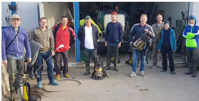
Die starken Regenfälle ab Mitte Mai brachten großflächige Überflutungen mit unzähligen Gelsenbrutstätten ins Augebiet. Mit vereinten Kräften gingen mehrmals unsere Gelsenwehr (Bild), an zwei Tagen der Hubschrauber und erstmals auch die Drohne gegen die Gelsenlarven vor.