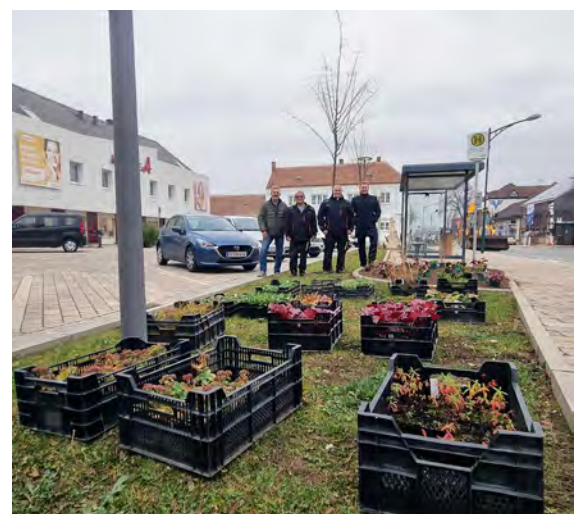
Nach Beratung und Bepflanzungsvorschlägen von Natur im Garten können sich die Hohenauerinnen und Hohenauer ab dem nächsten Frühjahr an bunten Pflanzenkompositionen erfreuen, die klimatisch und standortbezogen harmonieren. Mehr als 300m 2 Straßenbegleitgrün wurden neu bepflanzt.