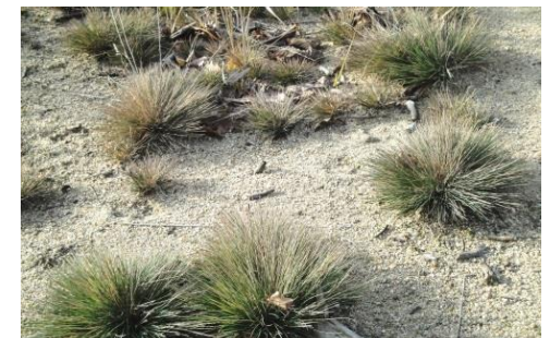
In den Sandbergen